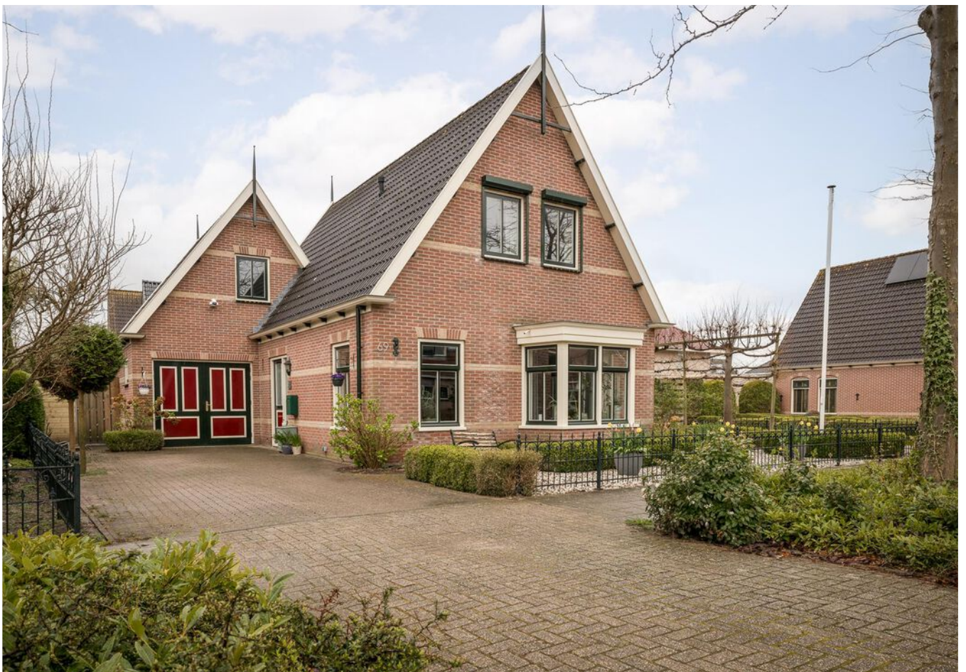
Laurier 69 HOOGKARSPÉL